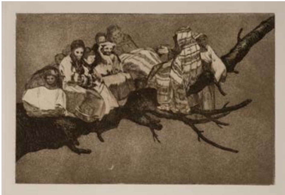
Burugabekeriak 3. Burugabekeria barregarria