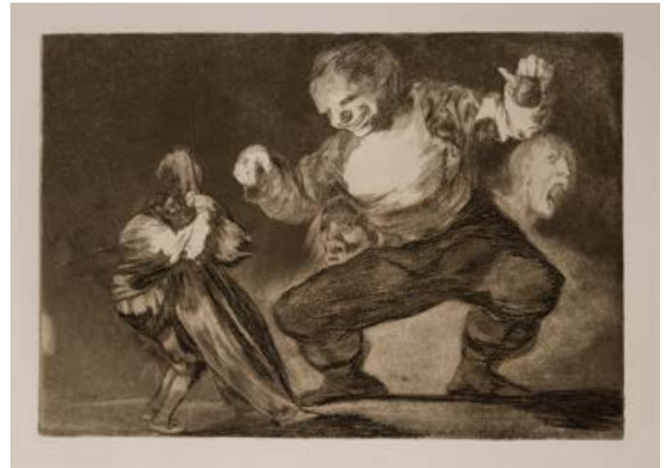
Burugabekeriak 4. [Kokoloa]