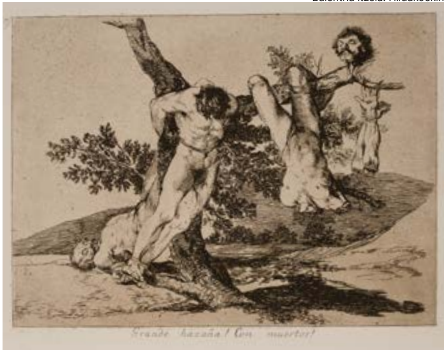
Gerraren hondamendiak 39. Balentria itzela! Hildakoeekin!