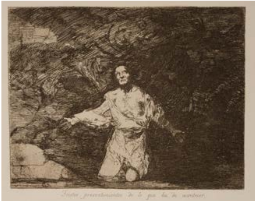
Gerraren Hondamendiak 1. Gertatuko denari buruzko susmo tristeak.